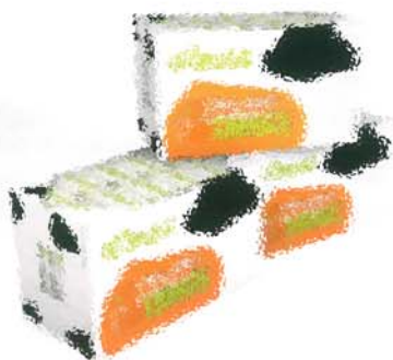
Auch kleine Einzelhandelsbetriebe werden von der Digitalisierung im Marketing profitieren.