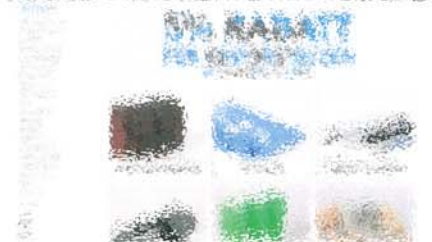
Die Produktpalette des Onlineshops umfasst eine Vielzahl von Werbeartikeln und Displays.

Der Wulf Isenberg Display Onlineshop ist ein Online-Shop für Industriekunden. Er bietet eine große Auswahl an Werbeartikeln und Displays. Die Produkte sind in verschiedenen Kategorien unterteilt, wie zum Beispiel Displays, Kundenwappen und Kleinstanzeigen. Der Shop ist einfach zu bedienen und bietet eine schnelle Lieferung. Die Preise sind wettbewerbsfähig und die Qualität ist hoch. Der Shop ist ein wichtiger Bestandteil des Marketing-Mixes für Industriekunden.